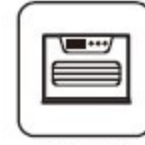
石油ファン ヒーター