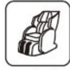
マッサージ チェア