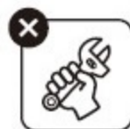
改造・加工 された商品