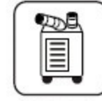
窓用エアコン スポットエアコン