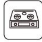
IHコンロ (ビルトイン以外)