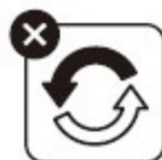
消耗品・付属品 の交換