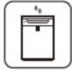
除湿器 衣類乾燥除湿器