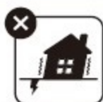
地震・噴火・津波に 起因する故障