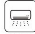
室内エアコン (セパレート)